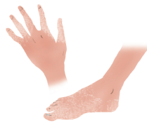
皮膚・ 粘膜の乾燥